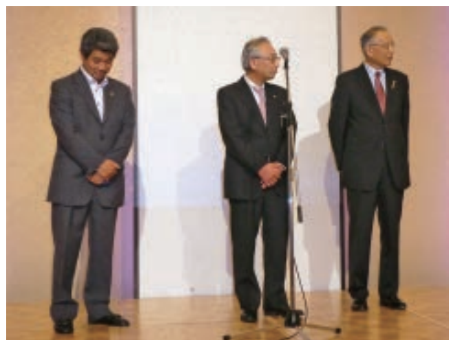
1年間ご苦労さまでした（6/21）