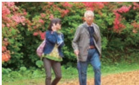
南三陸つつじ観賞家族例会(6/27)