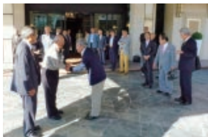
福島西交流芋煮例会(10/2)