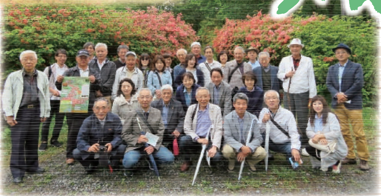
南三陸つつじ観賞家族例会 (5/27 徳仙丈山)