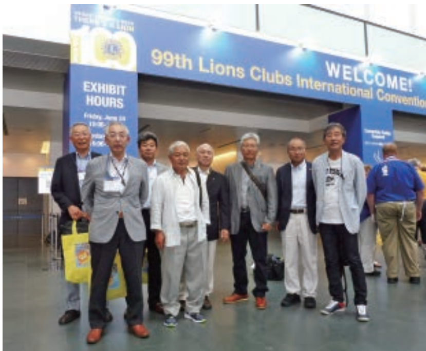
第99回福岡国際大会（6/24～28）